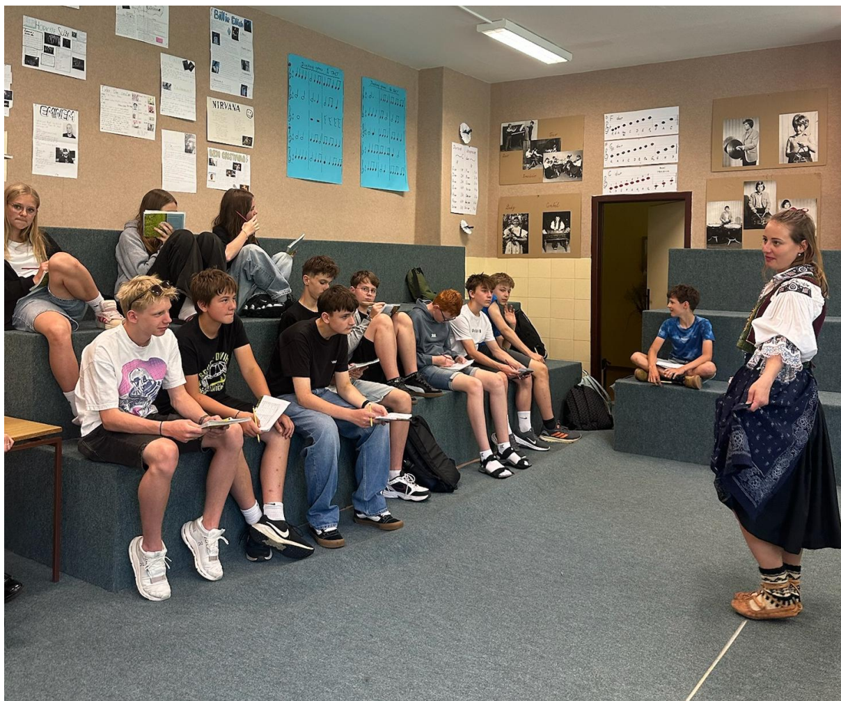
Jedna skupina ve folklorní dílně poznávala valašské kroje a věnovala se lidovým písním.