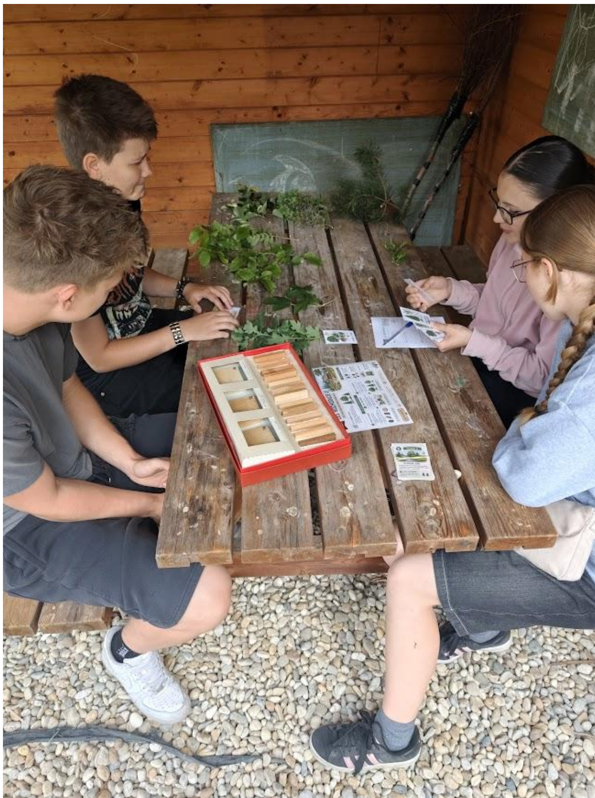
V přírodovědné dílně žáci ve venkovní učebně řešili strategickou hru zaměřenou na hospodaření a přežití na tradičních valašských usedlostech.