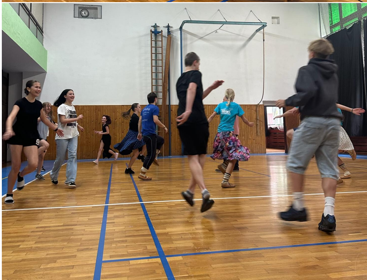
Druhá skupina si pod vedením členů souboru Vsacan vyzkoušela tradiční valašské tance.