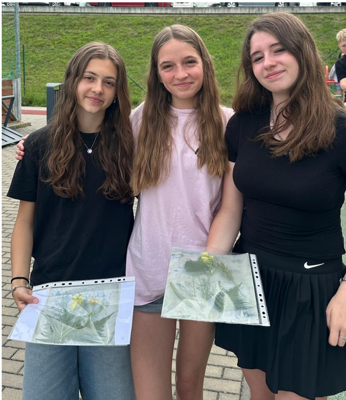
Originální otisky rostlin vytvořené technikou cyanotypie patřily k oblíbeným aktivitám projektových dnů Z kořenů Valašska.