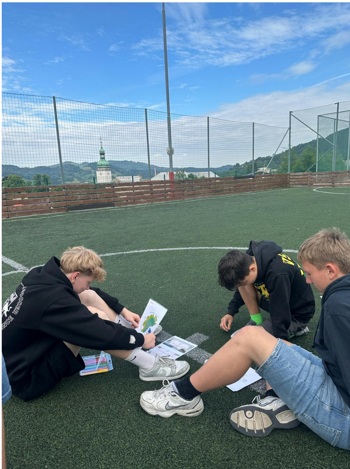
V zeměpisně-cestovatelské dílně jedna skupina žáků plnila týmové úkoly na jednotlivých stanovištích a poznávala významná místa našeho kraje.