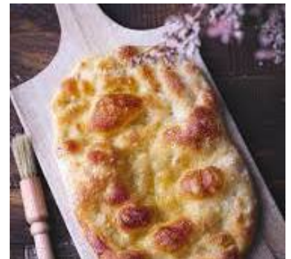
Pizza romana scrocchiarella