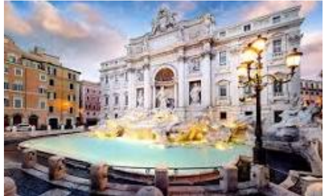
Fontana di Trevi