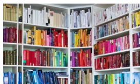
KNIHA PRO MLÁDEŽ