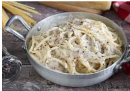
Tonnarelli Cacio & Pepe