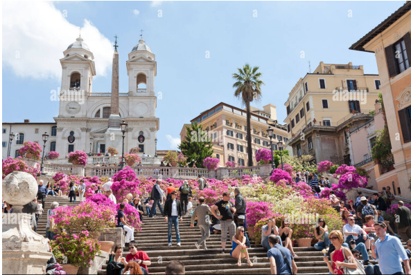
Piazza di Spagna