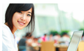
ŠKOLY VE SVĚTĚ Č.12