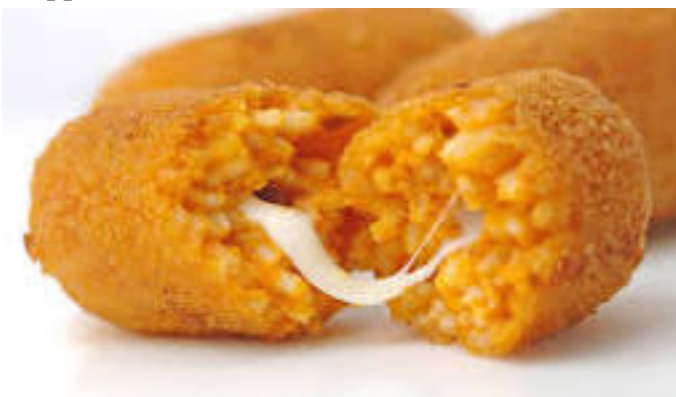
Suppli al telefono